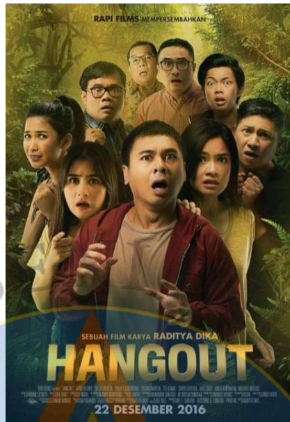
Gambar : 03 Poster Film : Hangout

Film Hangout menjadi referensi penulis dalam membuat cerita di film Inyiak . Persamaan cerita film yang akan penulis garap dengan film Hangout adalah jalan cerita yang terjadi disuatu tempat, adanya kasus pembunuhan dan alur cerita dari sudut pandang siapa yang menjadi pembunuh.