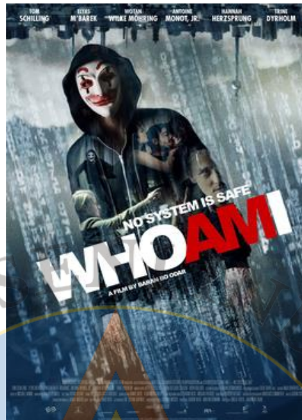
Gambar 1 Poster Film : Who Am I