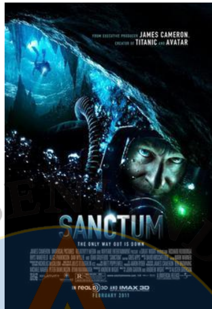
Gambar 2 Poster Film : Sanctum

Dari film ini terdapat teknik Split Edit yang menjadi referensi penulis nantinya pada film Inyiak . Selain teknik editing Split Edit penulis akan menggunakan Color Grading yang sama dengan Film tersebut penggunaan Low Highlight yang didukung dengan Temperature warna pada film lebih kebiruan.