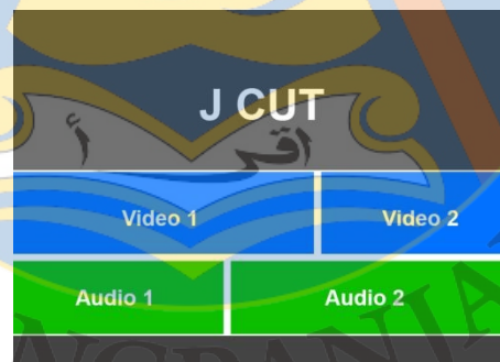
Gambar 4 Bentuk Timeline J Cut

Ross Hockrow dalam bukunya grammar of Out Of Order Storytelling Techniques for Video and Cinema Editor , mendeskripsikan J Cut terjadi ketika Audio dari klip berikutnya terdengar sebelum video, yang berarti anda mendengar audio sebelum anda melihat video yang sesuai dengan audio tersebut, ini bukan berarti anda melihat layar hitam anda hanya melihat klip A saat mendengar audio dari klip B (Ross Hockrow, 2015 : 124)