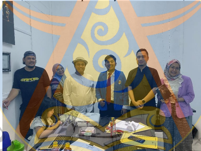
Gambar 22 Foto Bersama Pembimbing Dan Penguji Selesai Kompre