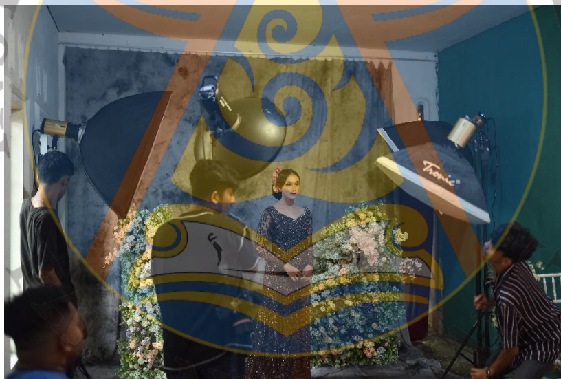
Gambar 17 Penataan Lighting