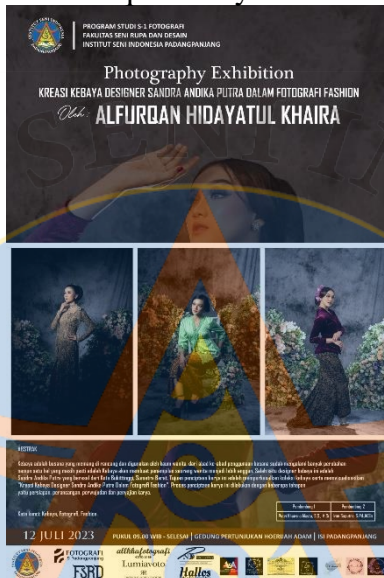
Gambar 24 Poster