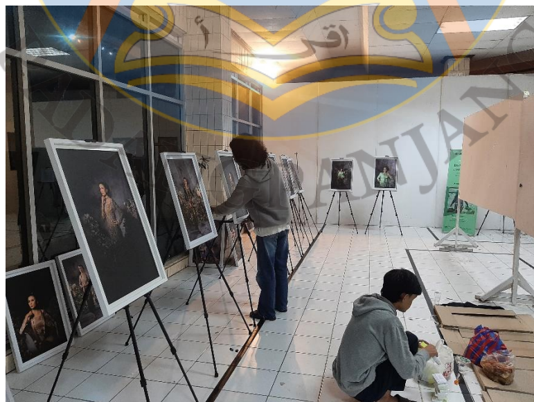
Gambar 20 Display Karya