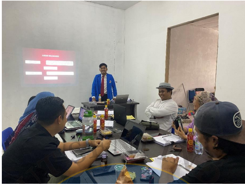
Gambar 21 Presentasi Kompre