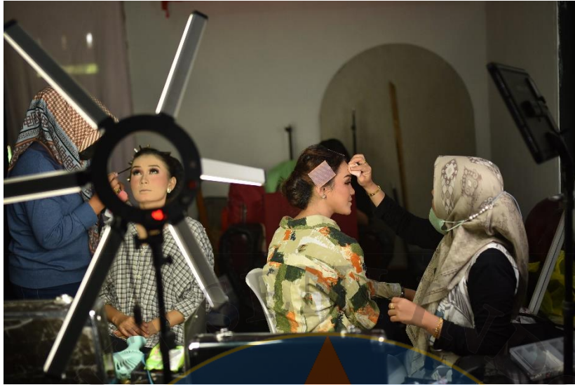
Gambar 16 Persiapan Make Up