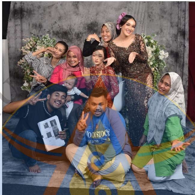
Gambar 19 Foto Bersama Team Dan Model